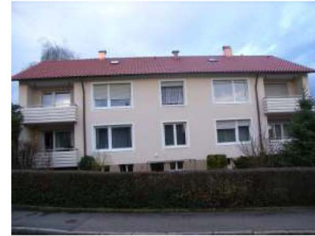
nach der Modernisierung (2009)