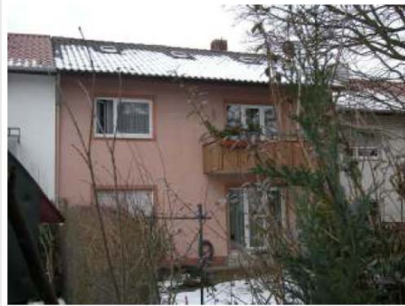
Gänsäckerstraße 27 vor der Modernisierung (2009)