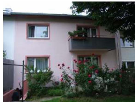
nach der Modernisierung (2010)