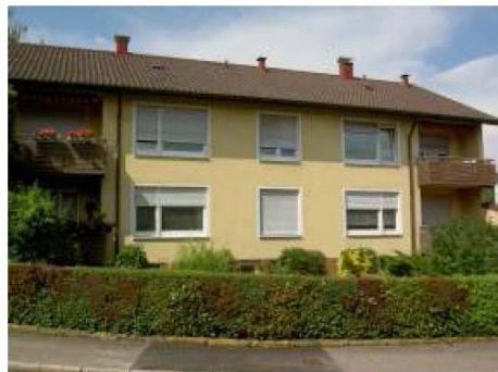
Sachsenweg 3 vor der Modernisierung (2009)