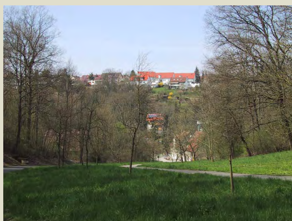
LANDSCHAFTLICH REIZVOLLE UMGEBUNG