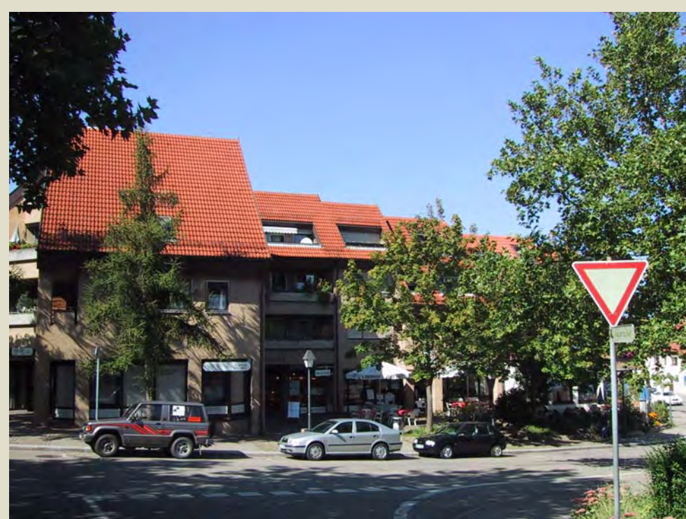
NUTZUNGSMISCHUNG IN DER ORTSMITTE

5. SICHERUNG, VERNETZUNG UND AUSBAU DER GRÜN- UND FREIRÄUME ZUR HERVORHEBUNG DER GRÜNEN IDYLLE