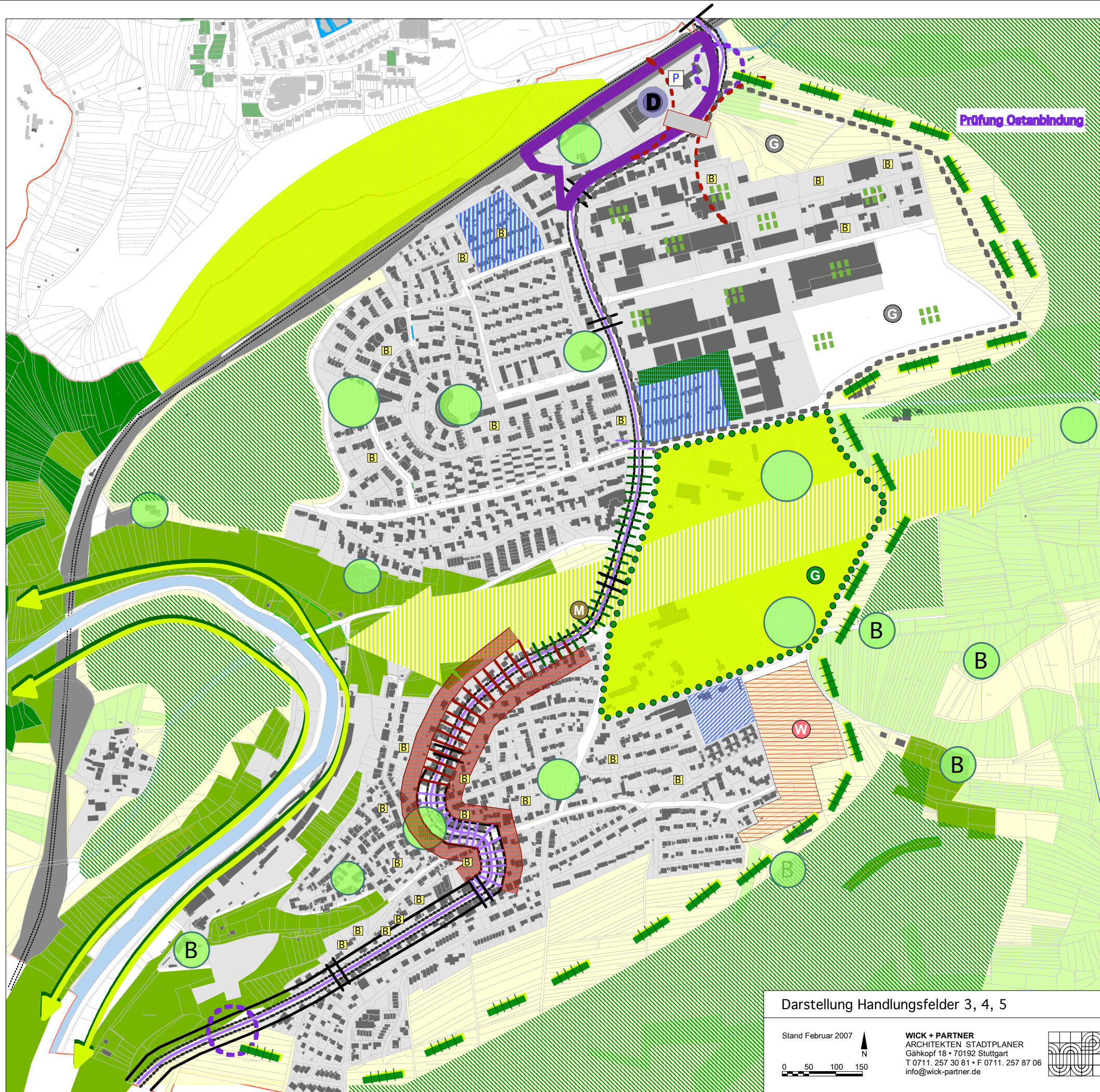
Darstellung Handlungsfelder 3, 4, 5