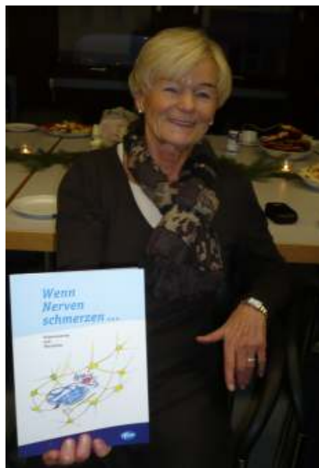
Erfahrungsaustausch in der Selbsthilfegruppe Polyneuropathie Rems-Murr

Der Gefühlsverlust kriecht über die Jahre die Beine hoch, früher oder später werden auch Hände und Arme befallen. Feinere Handarbeiten fallen schwer, das Zuknöpfen geht nicht mehr. Schließlich verlernt man, das Essbesteck zu gebrauchen. Häufiges Begleitsymptom sind die unruhigen Beine bei Nacht.