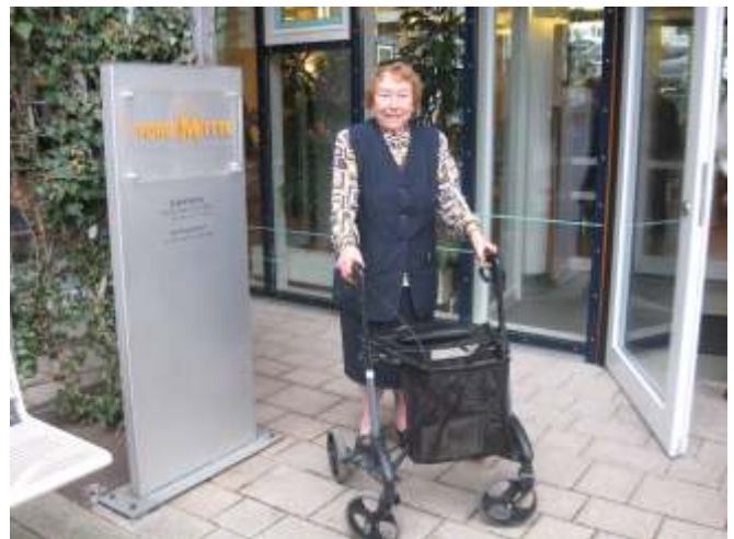
Else startet zur Einkaufstour

Wir biegen um die Ecke in den nächsten Gang, erfreut begegne ich meiner Kollegin Mira: Sie ist ein Luxusmodell. Das Fahrgestell in edlem Design, mit Doppelbremse, Griffhöhen mit Memory-Einstellung, der Sitz mit Stoff belegt, ein Netzkorb, und als zusätzliche Ausstattung Kantenabweiser und Ankipphilfe. Mira ist federleicht, braucht wenig Platz und steht zusammengeklappt standfest auf vier Rädern. Das ist alles ganz toll, aber Mira hat genauso wie ich mit den Tücken der Wege, Parkplätze und Straßen zu kämpfen. Auch Luxusmodelle müssen eben Hindernisse überwinden.