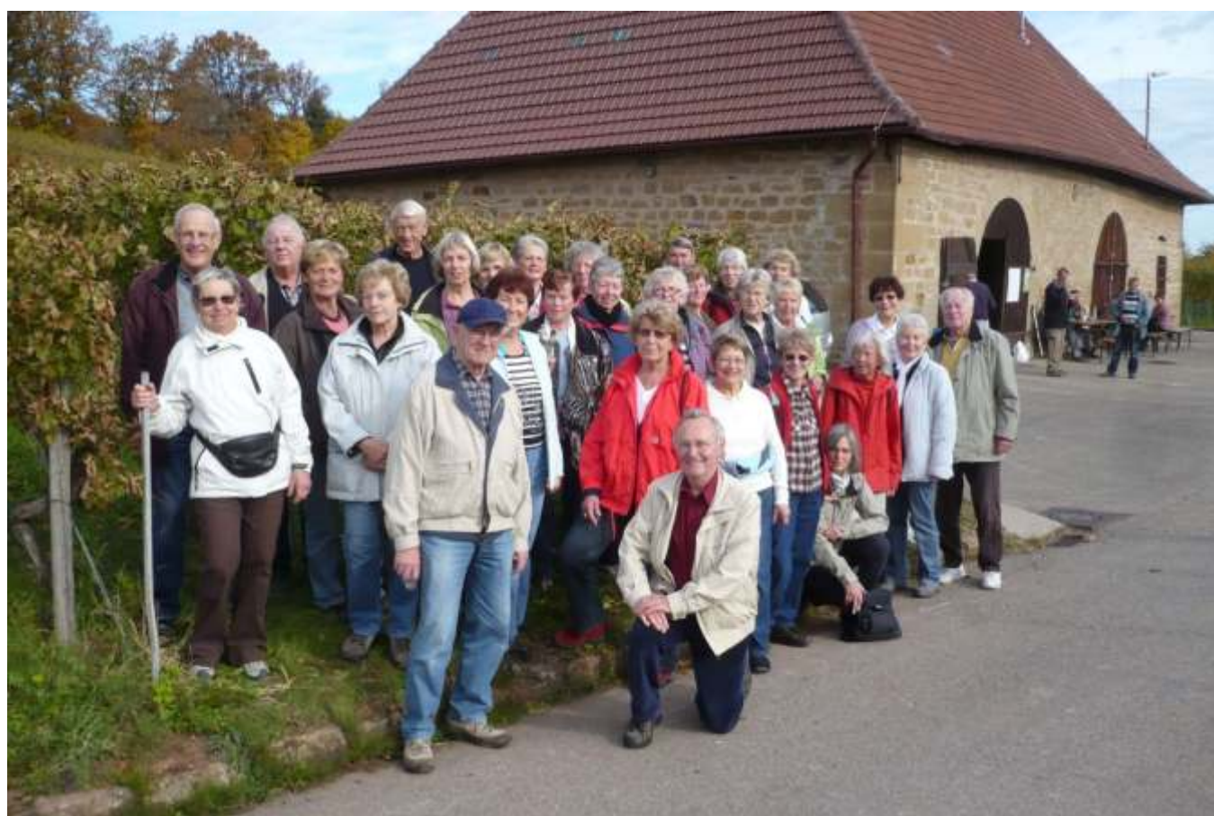
„Flott wandern mit dem Stadtseniorenrat“ macht bei Hanweiler eine Pause

Weitere Termine siehe unter "Was ist los in Waiblingen", Seite 20